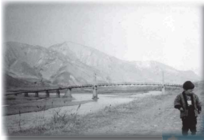
初代の冠着橋。吊り橋だった