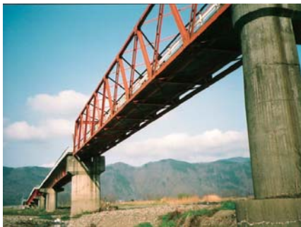
洪水の歴史を物語る橋脚