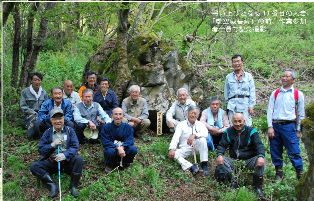
甲い上げとなる13番目の大岩「虚空蔵菩薩」の前。作業参加者全員で記念撮影