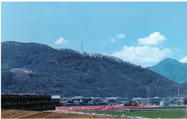
屋代田んぼから、有明山方面の景色。左の丘が森將軍塚古墳。右奥に見えるのが冠着山です。

古墳に登ると一望千里。気持ち落ち着きます。善光寺平、飯綱山や戸隠、西には険しく美しいアルプスの山並み。ふもとは屋代田んぼが広々と平らかです。この一角に実家の田があり、よくお手伝いしたことを思い出します。農作業は手仕事